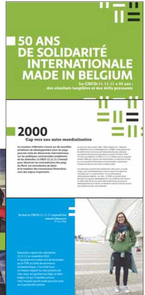
exemple d'utilisation Exposition 50 ans