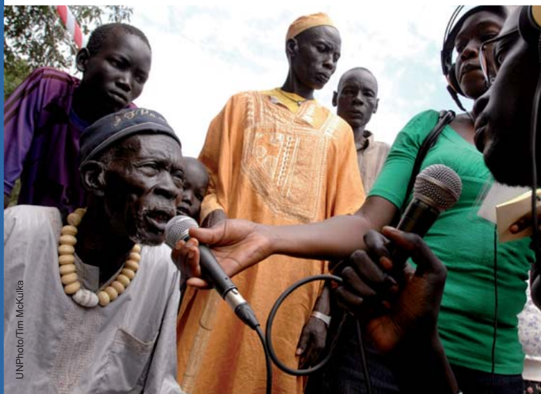
Le média le plus populaire en Afrique reste la radio, qui « parle » même aux illettrés et recueille la parole des populations sur les collines ou, comme ici au Soudan, dans la brousse.